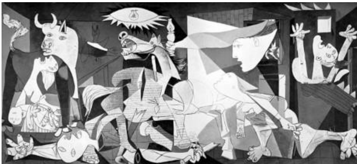
P. Picasso. Guernica , 1937

B. Prendendo ispirazione dall'opera Guernica , realizzare un elaborato tridimensionale, da collocare all'interno di una sala espositiva.