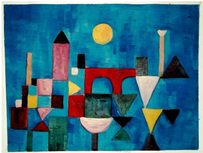
Paul Klee. Ponte rosso , 1928

A. Prendendo ispirazione da una tra le opere scelte dell'artista Paul Klee, realizzare un elaborato tridimensionale, da collocare all'interno di una sala espositiva.